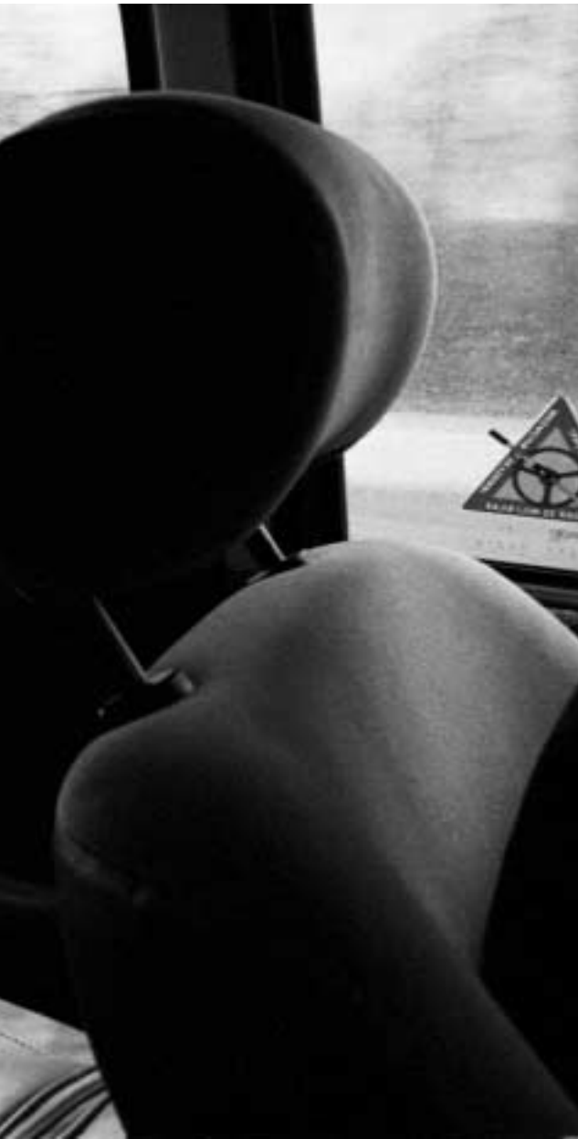
n läste hon in sig på toaletten... hon försökte ta sitt liv

hotar att spetsa till situationen för inte minst de utomeuropeiska invandrarna ytterligare.