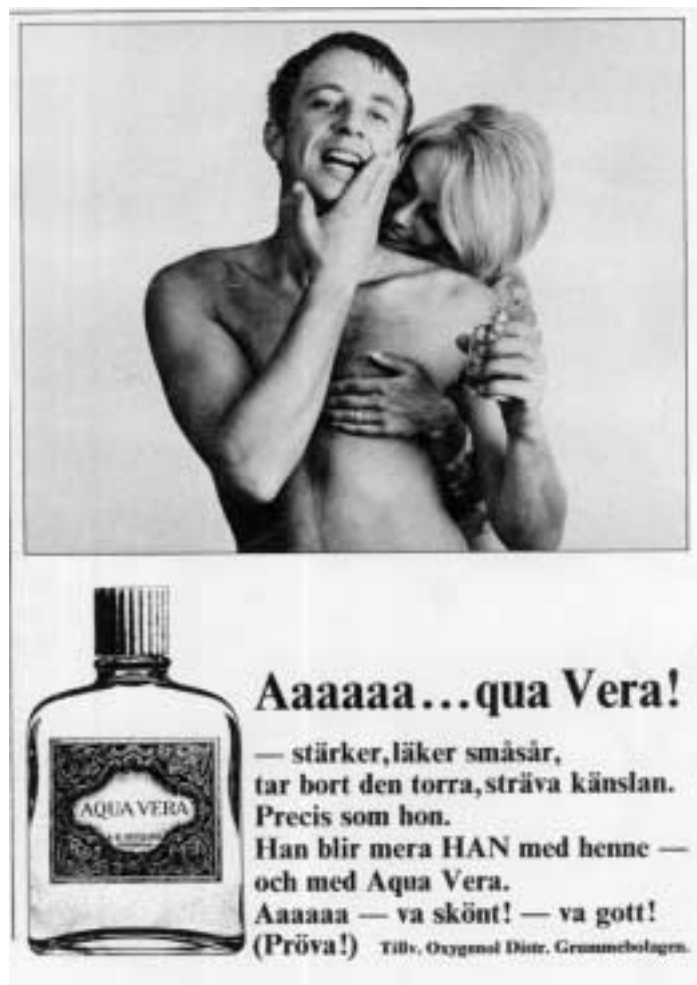
Ur Lektyr 1967. Hur mycket har egentligen hänt sedan dess?