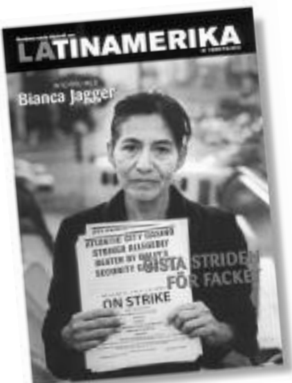
Du får fyra 84-sidiga nummer om året och ett förmånskort.

Beställ din prenumeration på la@ubv.se , skriv "Röda Rummet" på ämnesraden, eller gå in på www.ubv.se/la .