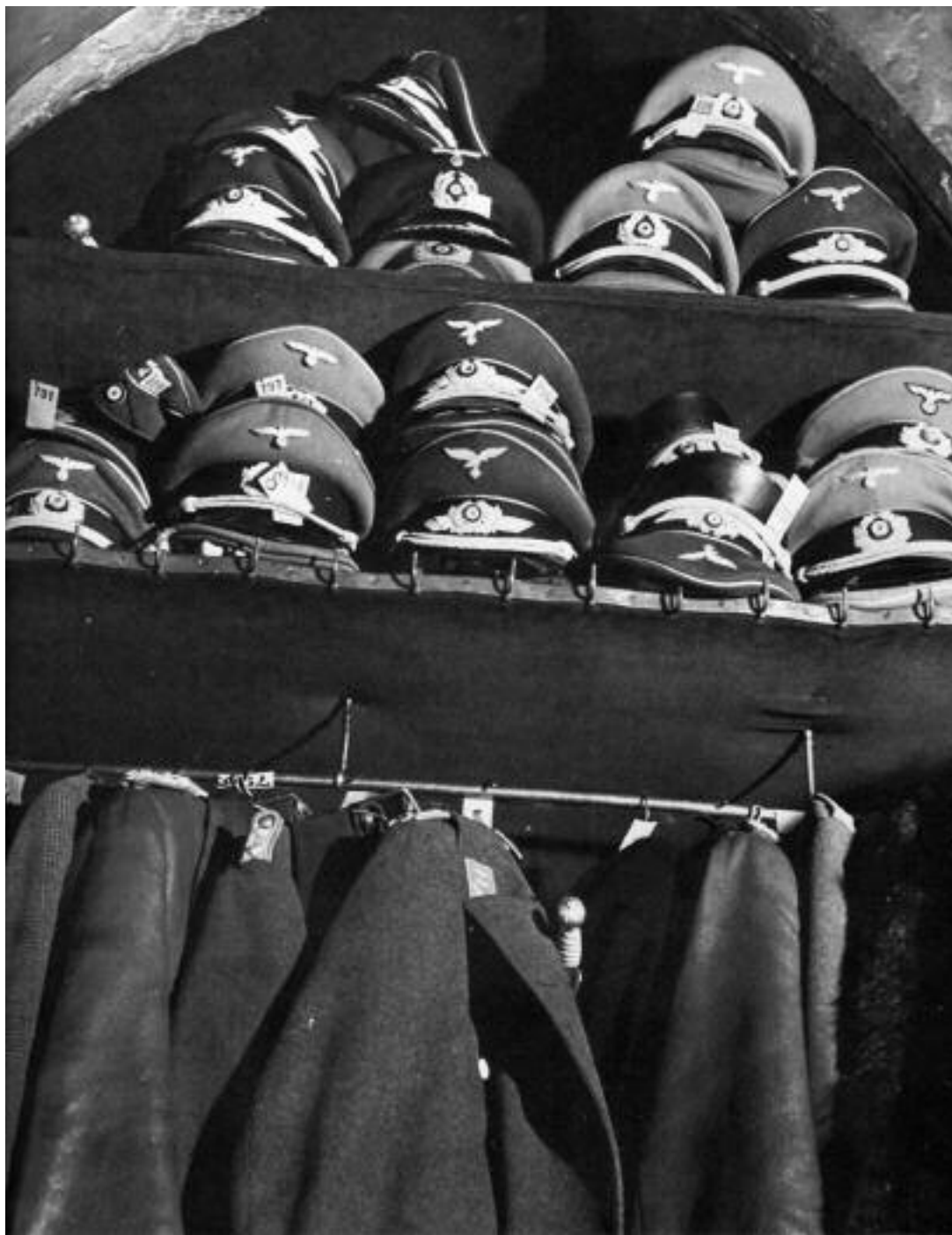
Hatthylla i ockupationens Paris

Ännu en gång begärde han att den brittiska imperialismen skulle erkänna fullbordat faktum. Men att finna sig i ett Europa som behärskades av Berlin utan att det längre fanns en mäktig självständig fransk armé (så som läget var i juni 1940) var ännu mindre meningsfullt för London än det tidigare förslaget från september 1939, när den franska armén fortfarande existerade. I båda fallen skulle det medföra säker undergång för Storbritannien som stormakt, för att inte tala om risken för att inom några år krossas militärt och ockuperas. Även om vi idag vet att den brittiske utrikesministern Halifax i krigskabinettet stödde Mussolinis försök att medla, samlades den överväldigande majoriteten av den brittiska härskande klassen kring Churchills beslut att ta strid där och då, utan att låta Hitler konsolidera, smälta och organisera sina erövringar. Hitler förstod detta, och avbröt inte för en dag sina militära, ekonomiska och politiska planer för att utvidga kriget, vare sig efter erövringen av Polen eller efter Frankrikes sammanbrott.