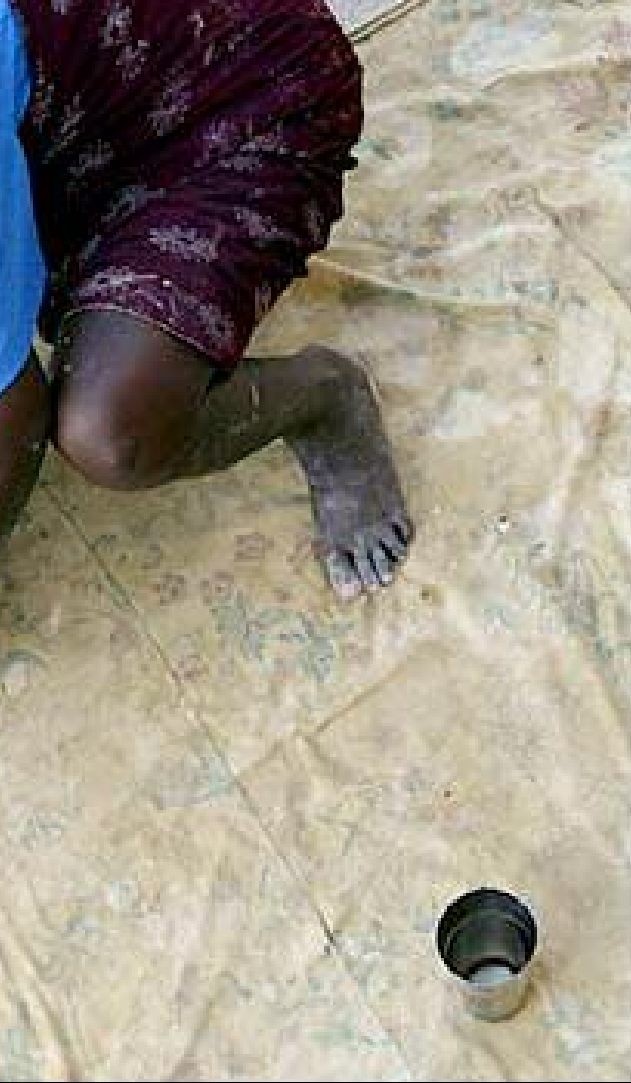
Bakning av "gyttjekex" i Haiti

att Jean-Bertrand Aristide – den förre presidenten i exil, vars regering 2004 störtades av utländska krafter – skulle återinsättas.