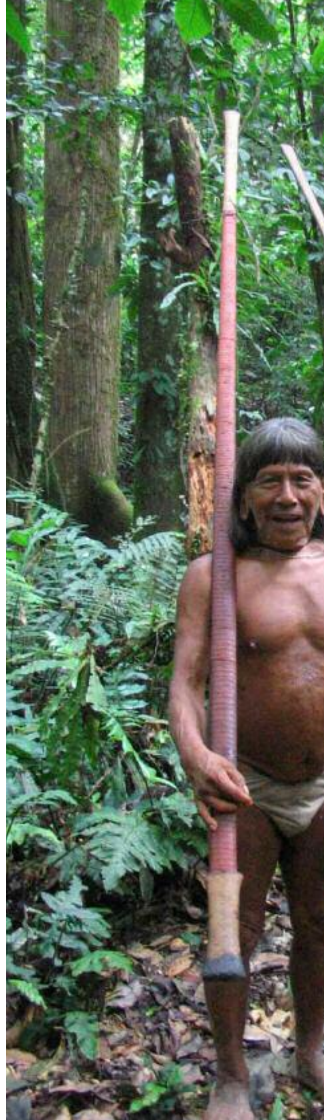
Huoranis i Amazonas

Även om president Correa är fast besluten att bli Ecuadors första president på ett decennium som får sitta hela mandatperioden, är de tvära politiska kasten norm, och regimförändringar kan göra Yasunís tillgångar sårbara. Å andra