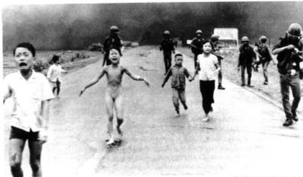
Photographie de Nick Ut, 1972.

I korthet nekades medlemmar i trotskistiska organisationer medlemskap i DFFG på grund av deras förmenta inställning till DFFG:s frontpolitik. För att hitta stöd för denna linje reproducerade DFFG den klassiska stalinistiska antitrotskismen. Utan att tveka använde man sig av