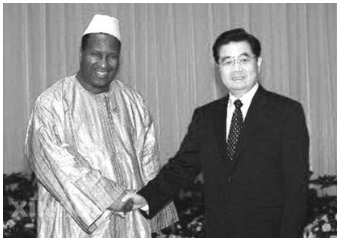
Kinas premiärminister Hu Jin-tau tillsammans med Sudans ledare Omar Bashir

I maj skärpte USA ensidigt sina sanktioner mot Sudan och Bush lovade att lägga fram förslag på en ny resolution i FN:s säkerhetsråd. Att Africoms första överbefälhavare är samma man som ledde operationen Restore Hope i Somalia 1993 är ett illavarslande tecken. Skulle en attack med kryssningsmissiler mot Khartoum (en repris på 1998) och en invasion av Darfur vara en lösning på den nuvarande krisen eller skulle det bara skapa ett Irak i Afrika?