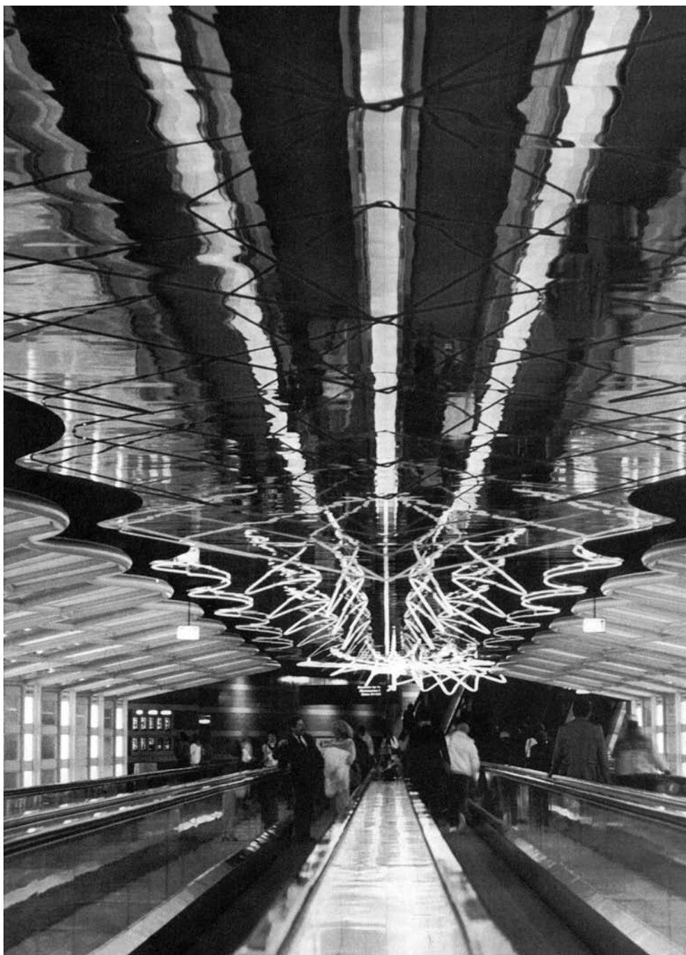
Det moderna rullbandet

och följaktligen utgör ett destabiliserande element, kommer saken i en helt annan dager. För vår del tror vi att de tenderar att utgöra ett stabiliserande element, men att de samtidigt bär på ett antal element av motsatt natur som lätt kan komma att ta överhanden.