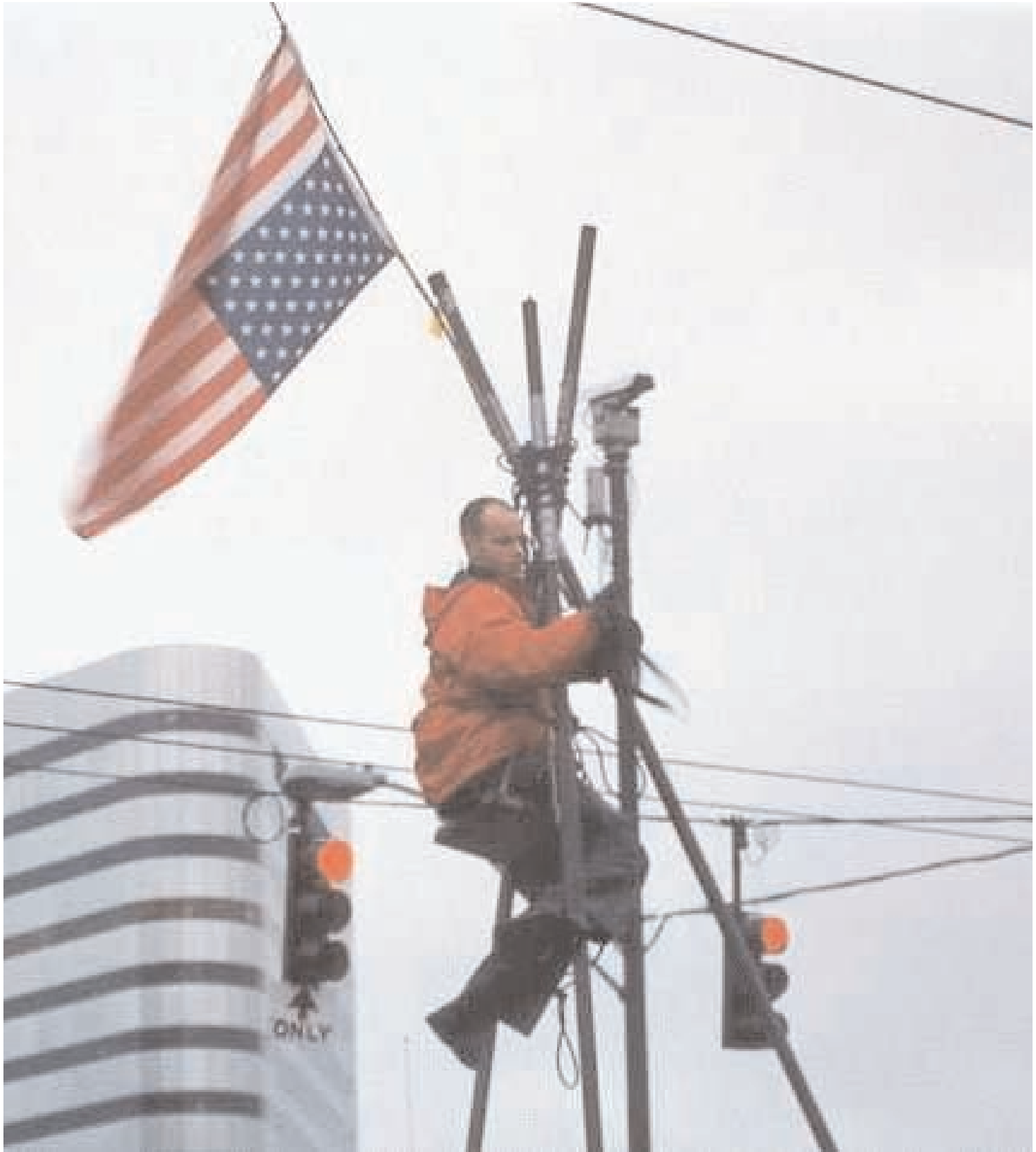
Demonstrant i Seattle 1999