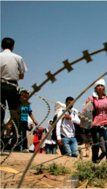
I Syrien beräknas halva befolkningen vara på flykt, över 4 miljoner av dem utomlands.

Detta gällde för flera av de länder som den arabiska våren manifesterades i. Den arabiska våren väckte stor glädje, stora förhoppningar och stora illusio-ner, inte bara i de berörda länderna utan bland människor över hela jorden. Men den spred också en illusion att framtidens omvälvningar inte behöver organisation utan enbart facebook och bloggare. I Egypten fick denna illusion en första smäll när Muslimska Brödra-skapet vann valet på grund av mångårig organisering och social förankring. En andra smäll fick den när militären visade vilka som verkligen hade kon-trollen när Muslimska Brödraskapet störtades. Den arabiska vårens öde har gett oss en smärtsam lektion i att det inte finns någon genväg som kan ersätta de arbetande massornas egen organisering – facklig organisering och framförallt politisk och ideologisk. Den demokratiska socialistiska organi-seringen är en nödvändighet. Arbetarklassens befrielse måste vara dess eget verk, kan bara vara dess eget verk. Saknas de arbetandes självorganisering hamnar de istället under andra krafters kontroll. I Syrien hade Baathpartiet under sin tidigare tid ett stöd bland fattiga bönder och arbetare. 2011 var detta stöd eroderat genom partiets diktatoriska uppträdande, genom kor-ruption och privilegier och nyliberala ”reformer”. Men det fanns en kraft utanför Baathpartiet som hela tiden var närvarande i massornas liv: moskén och islam. Under 2000-talets första decennium hade dessutom denna kraft