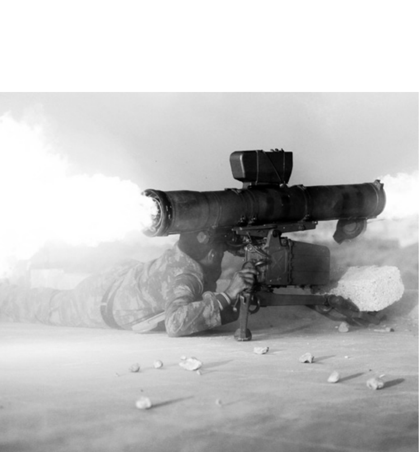
En soldat från den islamistiska gruppen Djabhat al-Nusra i Aleppo, Syrien, som använder sig av en automatisk granatkastare.

sad hade lagt sig vinn om att inför de kristna framstå som en garant för deras religionsutövning. Och i en region där kristna kunde se vad som hände i Irak och Egypten framstod Assads garantier inte enbart som tomt prat utan som reella. Så när konfrontationen tog fart i Homs med omnejd så var det inte oppositionen de flesta kristna drogs till. Vissa klaner drogs helt enkelt in i striderna på regimen sida. När kristna kidnappades och dödades av rebeller så svarade kristen milis med kidnappning av sunnimuslimer. I början av 2012 kunde man från moskéer i staden Qisir höra minaretutroparna slunga hotelser mot de kristna. De antikristna stämningarna underblåstes av att sunnitiska jihadistier från Libanon började förstärka rebellstyrkorna i området. Dessa såg från början konflikten genom sina religiösa glasögon. Många kristna tvingades i flykt. På våren 2012 kom regimen offensiv. Den sunnitiska stadsdelen Baba Amr som var ett tungt fäste för rebellerna började utsättas för mördande artillerield. Från och med nu började fler inse att de räknat ut regimen för tidigt.