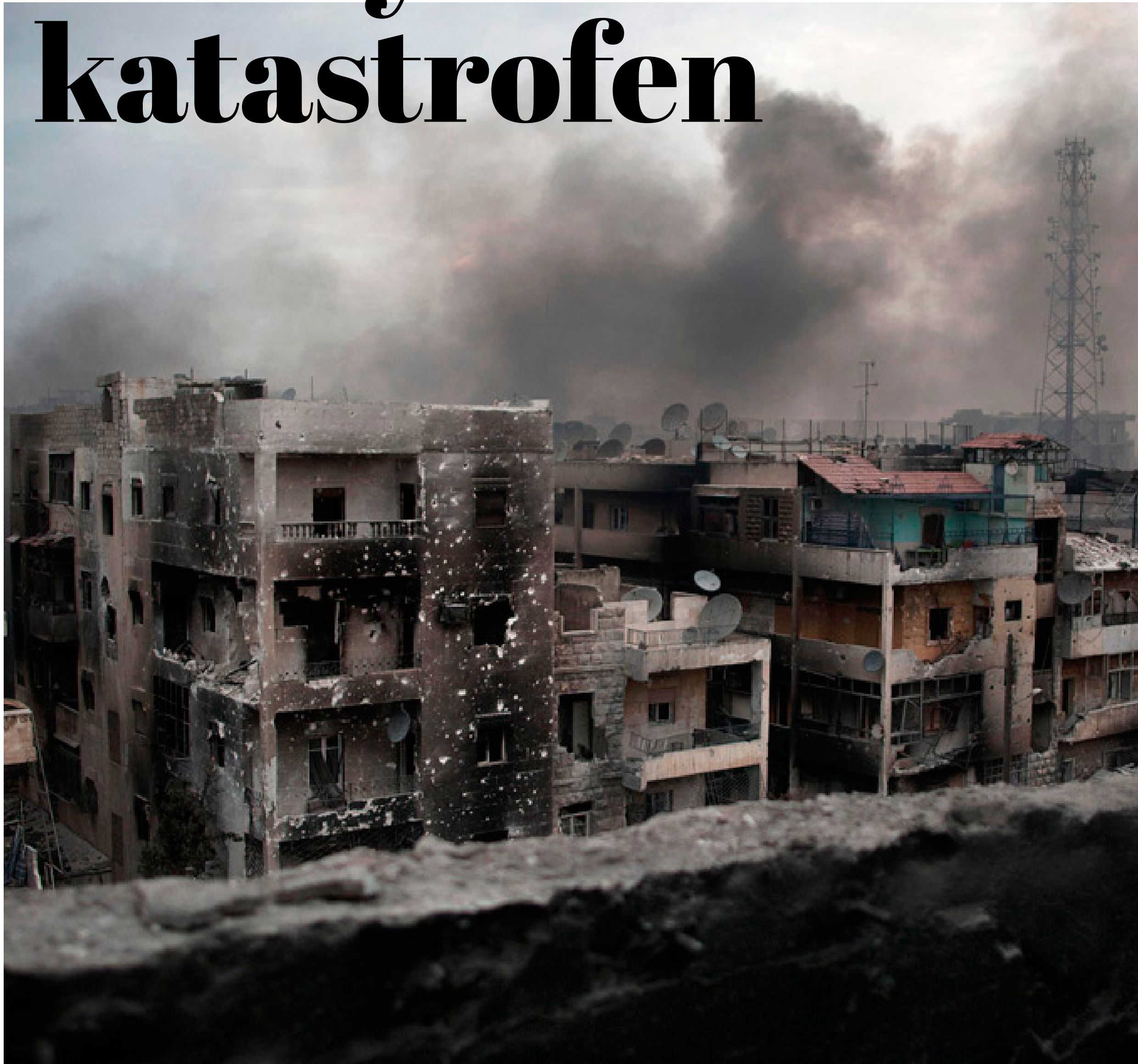
BILD. Aleppo, Syrien.