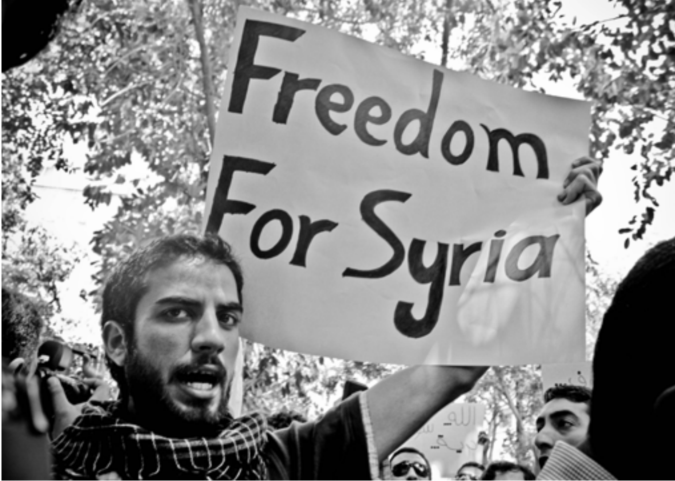
En demonstration i Libanon för att avsluta styret i Damaskus.