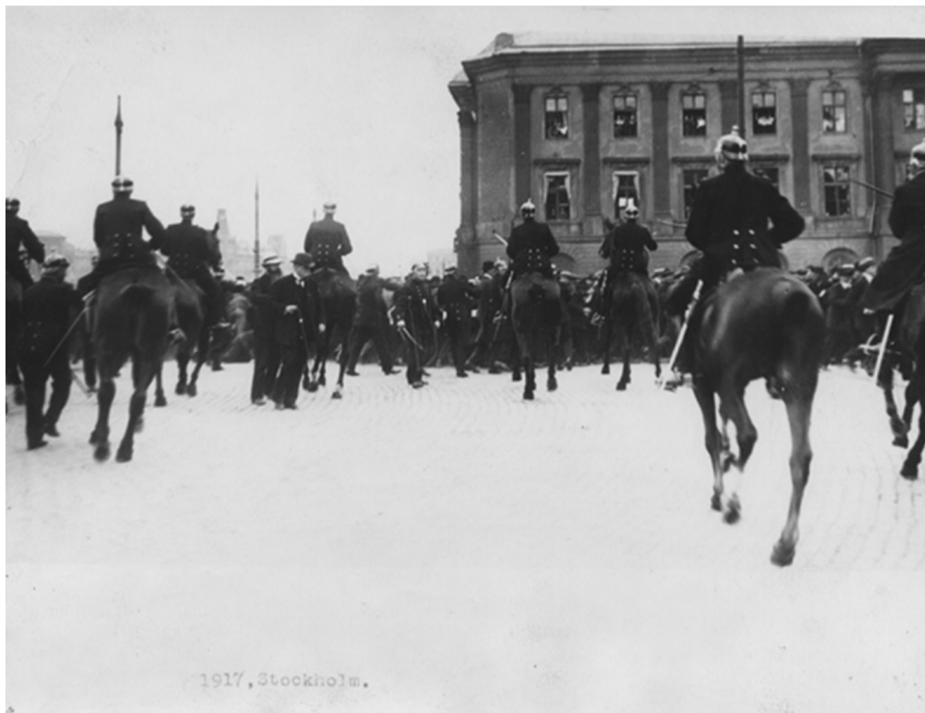
BILD. Hungerkravaller i Stockholm på Gustav Adolfs torg, 5 juni 1917. Den person (med käppen) som håller på att ta sig bort från platsen är Hjalmar Branting.