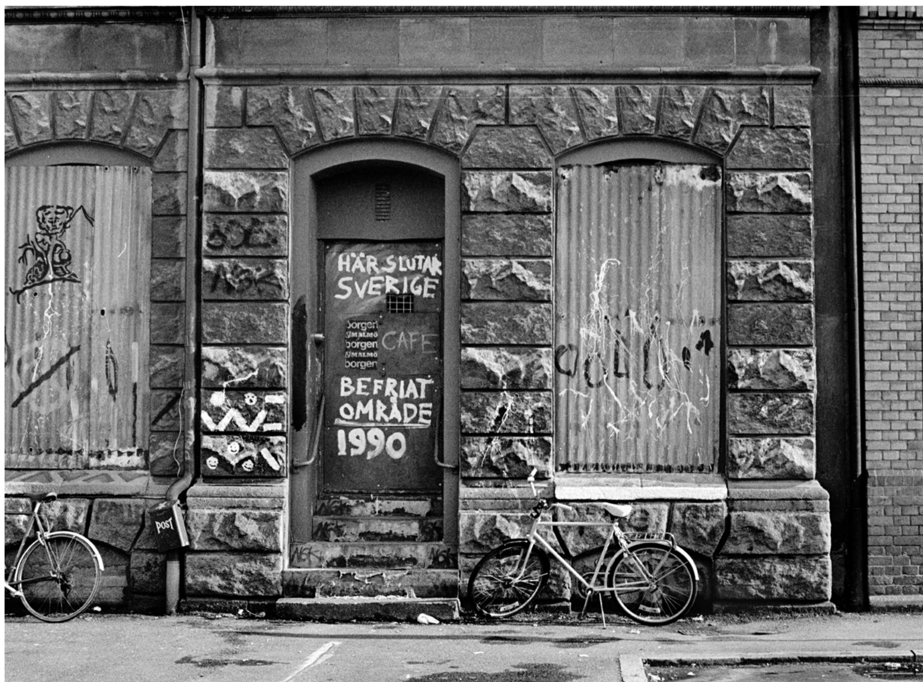
BILD. Ingången till "Borgen", på Värnhemstorget i Malmö, där Entré ligger idag.

Med dessa delvis kritiska synpunkter vill jag ändå som sagt rekommendera boken till alla som vill lära av historien.<<