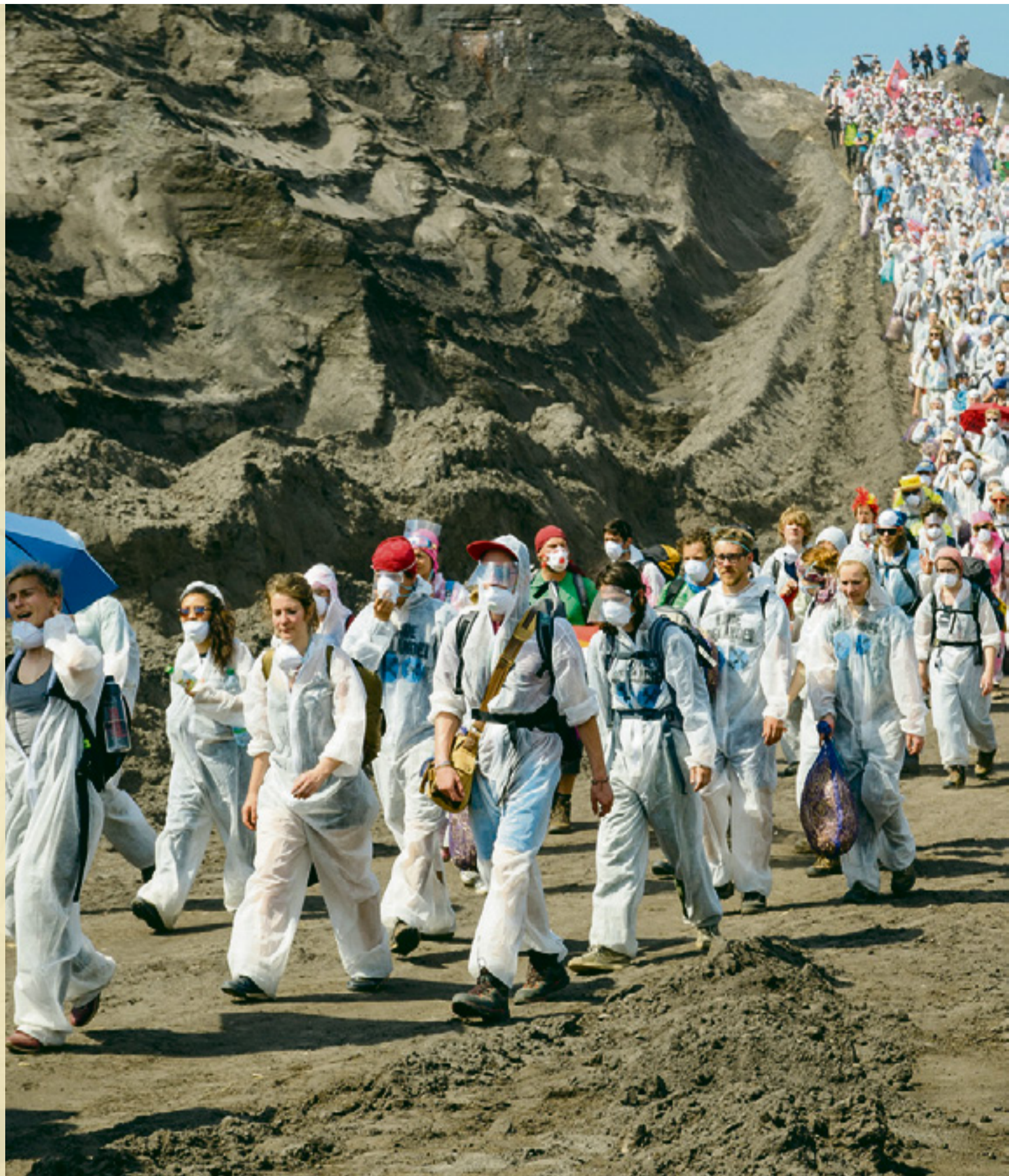
BILD. Klimataktivister från Ende Gelände i Tyskland tidigare i år.

är forskare i humanekologi och författare. Han har bland annat givit ut När kapitalet tar till vapen: Om imperialism i vår tid , 2004, och Det är vår bestämda uppfattning att om ingenting görs nu kommer det att vara för sent , båda Atlas förlag, 2007. Hans senaste bok är Fossil Capital: The Rise of Steam Power and the Roots of Global Warming Verso Books, 2016.