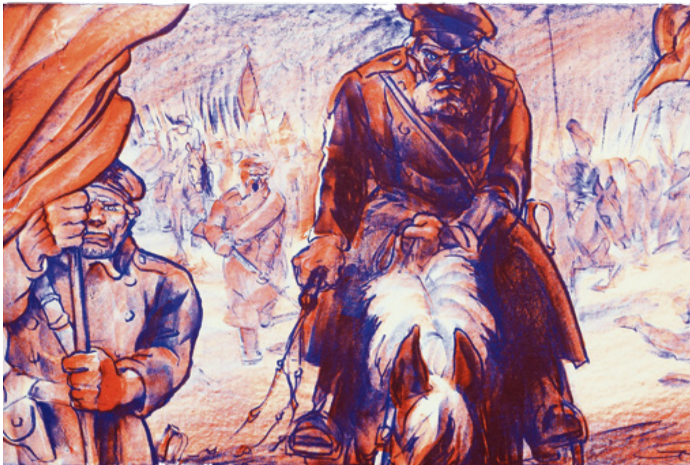
BILD. Urklipp från en affisch från det så kallade "Kosackvalet" 1928. Texten på affischen löd "En var som röstar på "Arbetarepartiet" röstar på Moskva".

har en mer än 40-årig fredsgärning bakom sig, i Svenska Freds, Fredsam och andra organisationer. Idag leder de fredsrörelsen på Orust där de arrangerar föreläsningar samt studiecirkel på aktuella teman.