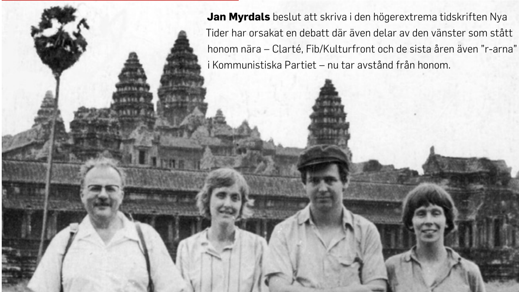
BILD. Jan Myrdal med resesällskap i Kambuchea augusti 1978. I bakgrunden Angor Vat.

Jan Myrdals beslut att skriva i den högerextrema tidskriften Nya Tider har orsakat en debatt där även delar av den vänster som stått honom nära – Clarté, Fib/Kulturfront och de sista åren även "r-arna" i Kommunistiska Partiet – nu tar avstånd från honom.