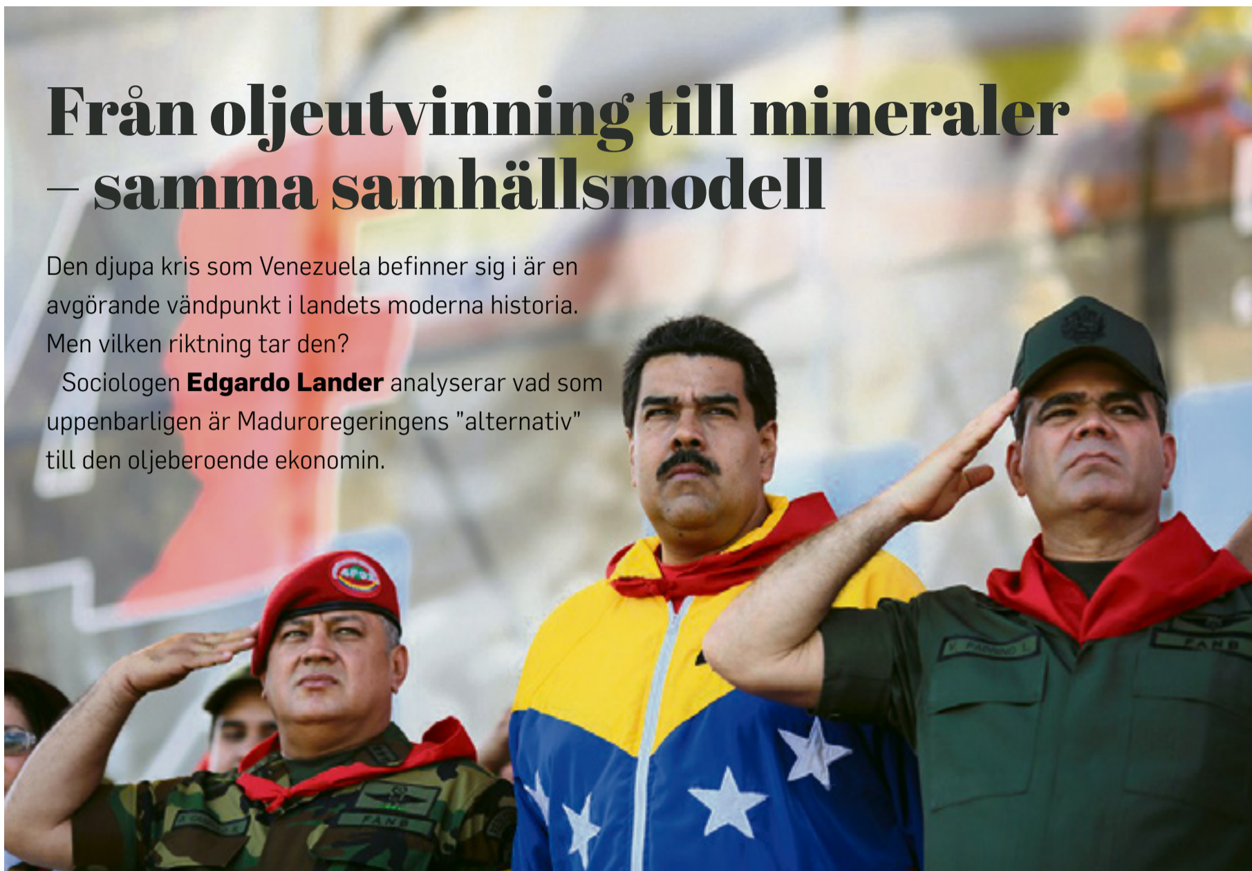
BIILD. I mitten Venezuelas president Nicolás Maduro.