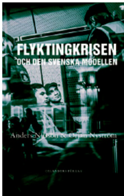
ANDERS NILSSON & ÖRJAN NYSTRÖM Flyktingkrisen och den svenska modellen Celanders förlag, 2016

När det gäller arbetsmarknaden är det dock en smula förvånande att författarna inte med ett enda ord tar upp vilken roll en eventuell arbetstidsförkortning skulle kunna spela. I det sammanhanget går det inte heller att komma ifrån att dagens arbetsmarknad uppvisar rejält motsägelsefulla drag; när, enligt Arbetsförmedlingens senaste siffror, hela