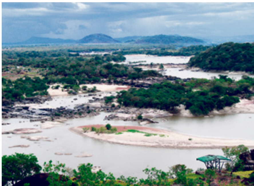
BILD. Orinoco deltat, Venezuela