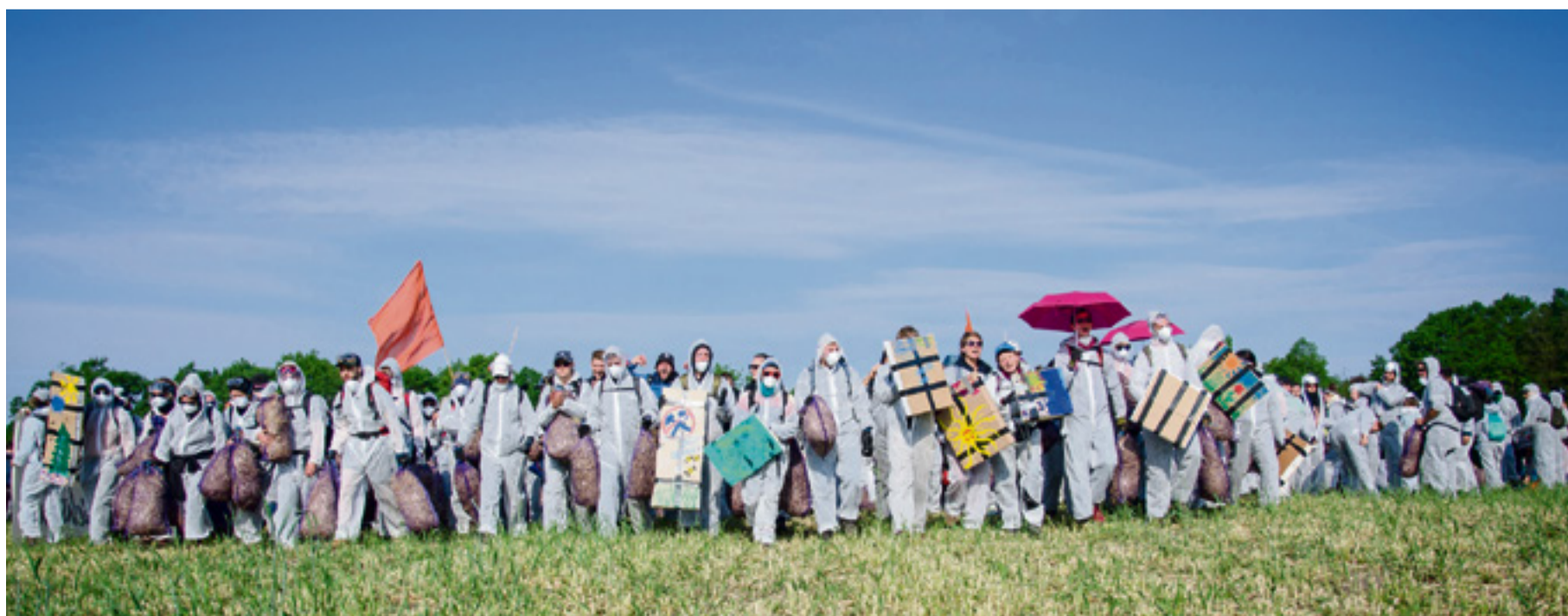
BILD. Ende Gelände

Kan klimatrörelsen växa i omfång med flera storleksordningar, samla progressiva krafter runt sig och utveckla en bärkraftig strategi för att kanalisera sin mål genom statsmakten - allt inom en tidsram som är relevant i denna snabbt allt hetare värld? De är en svår utmaning, för att uttrycka det mycket mildt. Men för att citera Daniel Bensaid, den kanske mest lysande teoretikern vad gäller revolutionär strategi från andra halvan av förra århundradet: "allt tvivel handlar om möjligheterna att nå framgång, inte om nödvändigheten av att försöka" <<