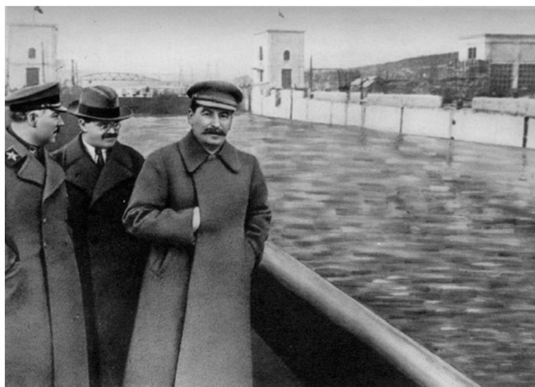
BILD. Under Stalinepoken sattes historieförfalskning i system. När personer råkat i onåd försökte man utradera alla spår av dem (om det inte gällde att svartmåla dem). De försvann från affischer och målningar, samt bortretuscherades från fotografier. Här är ett exempel. Originalfotot, som togs under en promenad vid stranden till Moskva-Volga-kanalen, visar Vorosjilov, Molotov, Stalin och NKVD-chefen Jezjov. På det andra har Jezjov (som utrensades 1939) försvunnit.