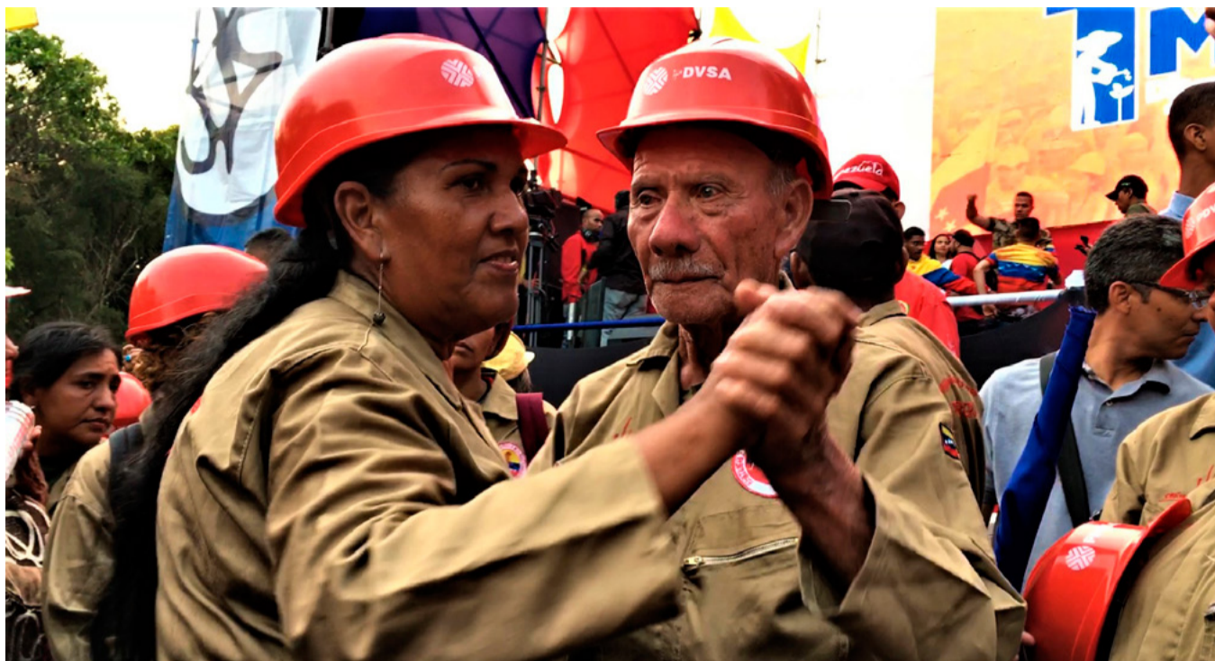
BILD. Oljearbetare i Caracas tar en sig svängom under årets 1 maj-firande.

EU har under 2019 fortsatt att trappa upp det ekonomiska kriget mot Venezuela. I slutet av januari tillkännagav USAs regering att det statliga oljebolagets PDVSA:s alla tillgångar i USA blockeras och att alla invånare i USA förbjuds att på något sätt handla med det venezolanska bolaget. Enligt USAs nationella säkerhetsrådgivare, John Bolton, kommer åtgärden att medföra en förlust på elva miljarder dollar av exportintäkter under 2019, och att tillgångar för sju miljarder blir låsta. Om Venezuela vill sälja olja till USA ska betalningar sättas in på bankkonton som den USA-stödda oppositionen har kontroll över. Det betyder att det raffineri, Citgo, som PDVSA har i USA, nu kontrolleras av oppositionen. Den utvidgade finansblockaden medförde att Venezuelas oljeproduktion i mars sjönk till 736 000 fat per dag – hälften av det som producerades i mars förra året, och inte ens en tredjedel av de tre miljoner fat per dag som producerades för 10 år sedan.