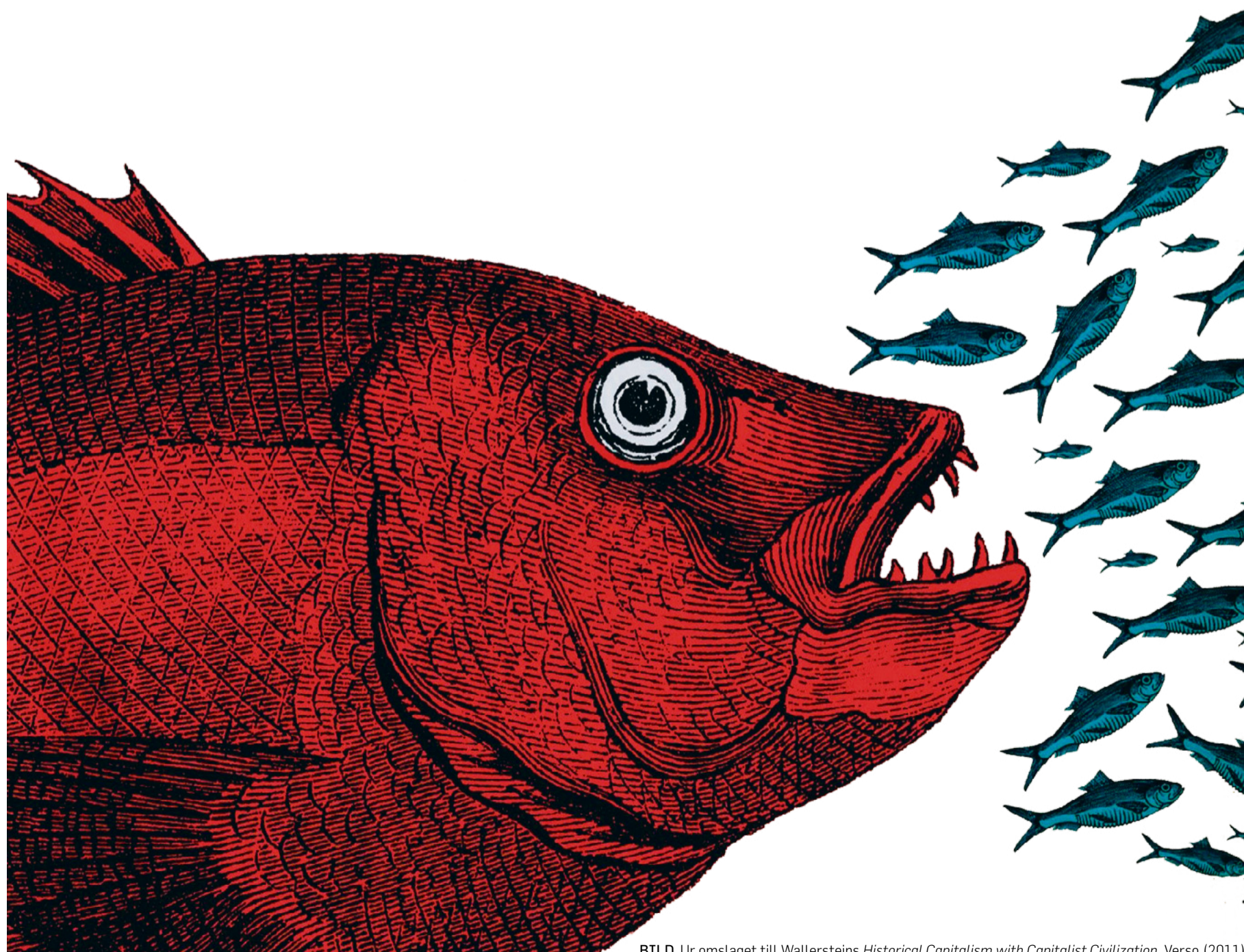
BILD. Ur omslaget till Wallersteins Historical Capitalism with Capitalist Civilization , Verso (2011)

Varje samtida politisk teori måste på ett eller annat sätt förhålla sig till kapitalismen som ett system med global omfattning – om inte annat genom analysens avgränsningar. För Immanuel Wallerstein är det själva den globala räckvidden som är analysens utgångspunkt. Carl Cassegård beskriver teorin om Världssystemet och dess historiska och idémässiga sammanhang i Röda rummets serie över samtida marxistiska teoretiker och aktivister.