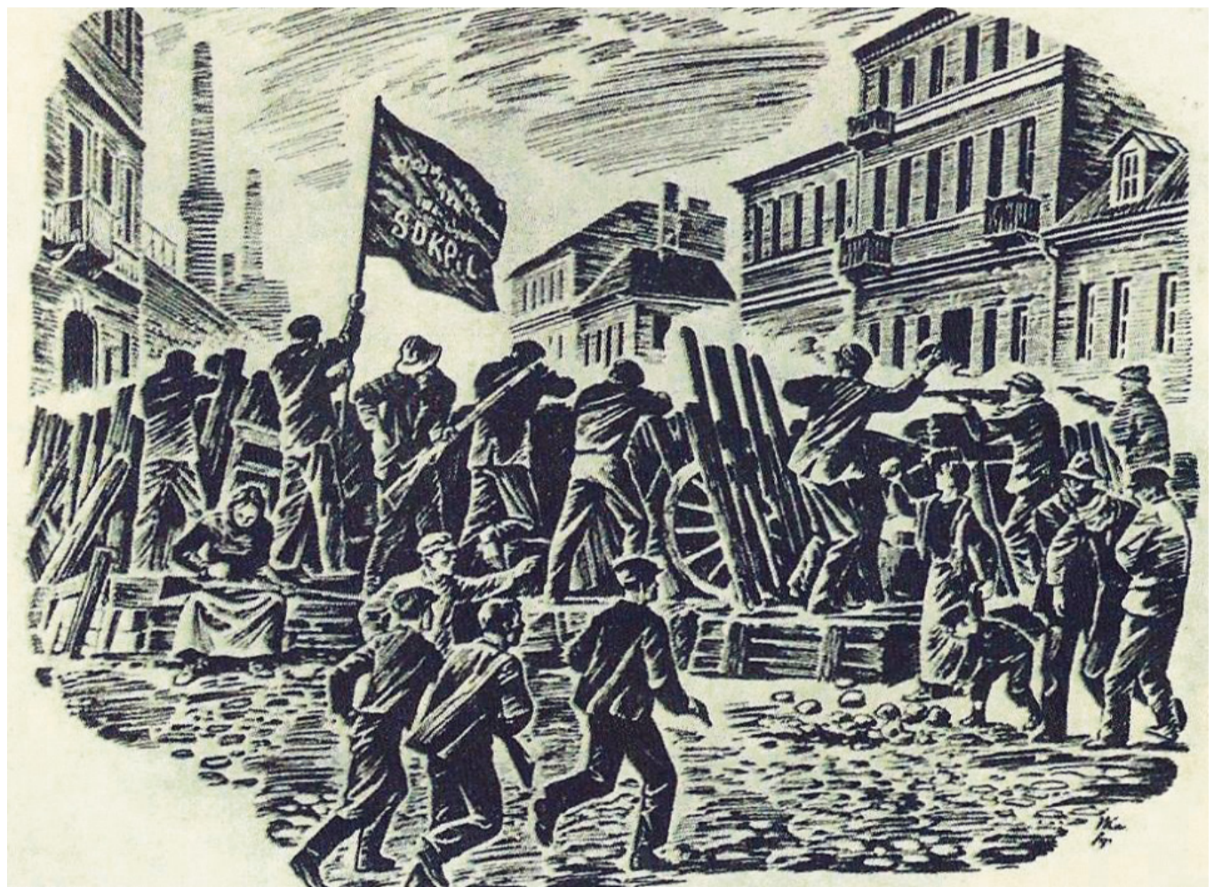
BILD. Illustration av upproret i Lodz, 1905. Över barrikaden vajar SDKPiL:s fana.

är historiker i Oakland, Kalifornien. Han har skrivit Anti-Colonial Marxism: Oppression & Revolution in the Tsarist Borderlands (Brill Publisher).