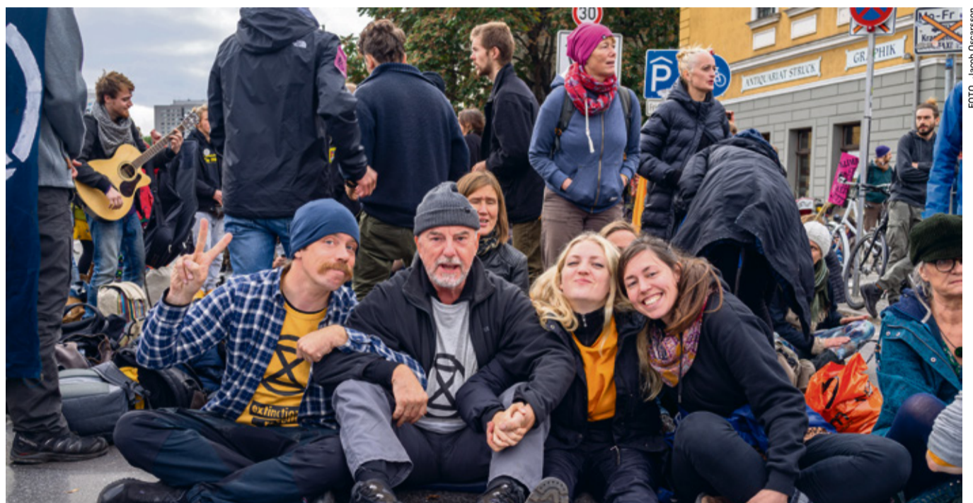
BILD. XR-blockad i Berlin 2019.

är till yrket programmerare. Han är aktivist i Extinction Rebellion och medlem i Vänsterpartiet samt i Socialistisk Politik.