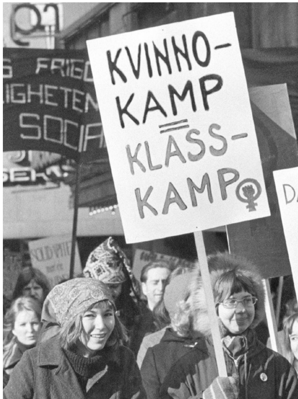
BILD. Kvinnokamp 1974.

Trots dessa orättvisor så skapade nu för första gången i historien möjligheter för kvinnan att bli ekonomiskt oberoende. Den ryska bolsjevikerna Alexandra Kollontaj skrev att det som mest bidrog till att radikalt förändra familjevanorna "var utan tvekan det allmänna spridandet av lönearbetet bland kvinnorna".