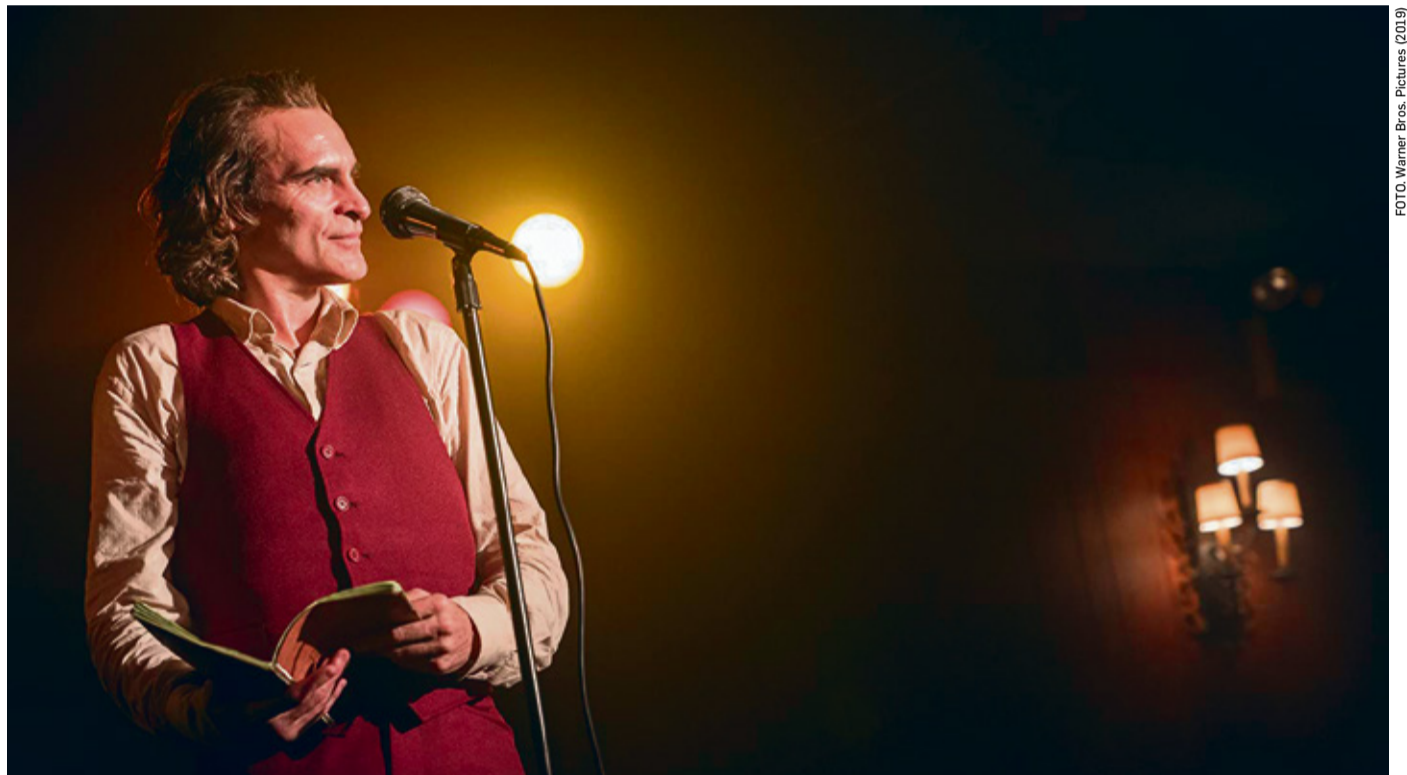
BILD. Joaquin Phoenix som Arthur Fleck i filmen Joker .

är docent i kulturstudier vid Institutionen för Kulturvetenskaper vid Göteborgs Universitet. Hon forskar om stadsutveckling och ojämlikhet.