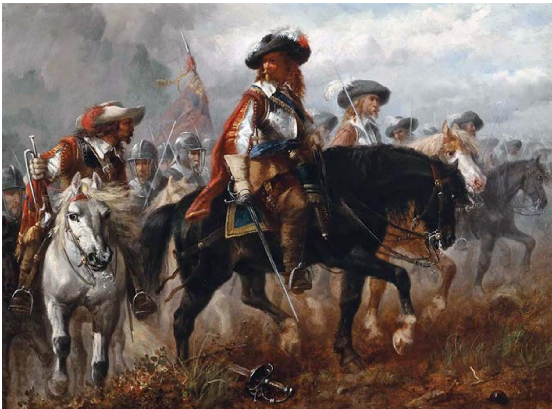
Karl I av England och Prins Rupert före slaget vid Naseby 14 juni, 1645.