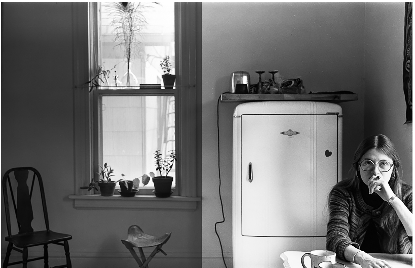
Chuck Patch, "M in the kitchen", 1975. CC BY-NC 2.0 (Bilden är redigerad)

Familjen är ett centralt element för den kapitalistiska reproduktionen. Evelina Johansson Wilén resonerar utifrån samtida debatter om hur dagens och gårdagens feminister förhållit sig till denna institution.