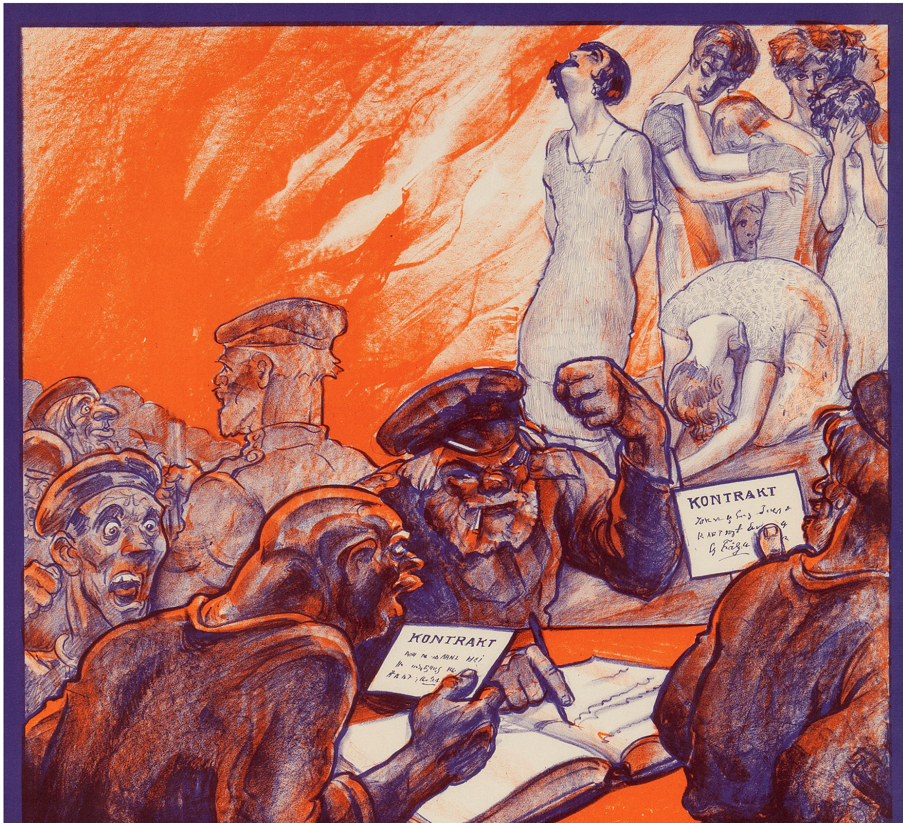
BILD. En av högerns affischer i det s.k. "Kosackvalet", 1928. Affischen pryddes av texten "SVERIGES KVINNOR! En var som röstar på 'arbetarepartiet' röstar för familjebandens upplösning, barnens förvildning och sedernas förfall." Illustration: Gunnar Widholm.

Vad är alternativet? Detta är ofta frågan som ställs till kritiker av familjen . Det är svårt att föreställa sig andra sätt att organisera samhället som varken är hyperindividualiserade eller överlämnar alltför mycket ansvar för den sociala reproduktionen till staten och på det sättet kompromissar med människors autonomi. Trots dessa svårigheter försöker M. E. O'Brien formulera ett alternativt bud i boken Family Abolition (som lite slarvigt kan översättas till Familjens avskaffande ).