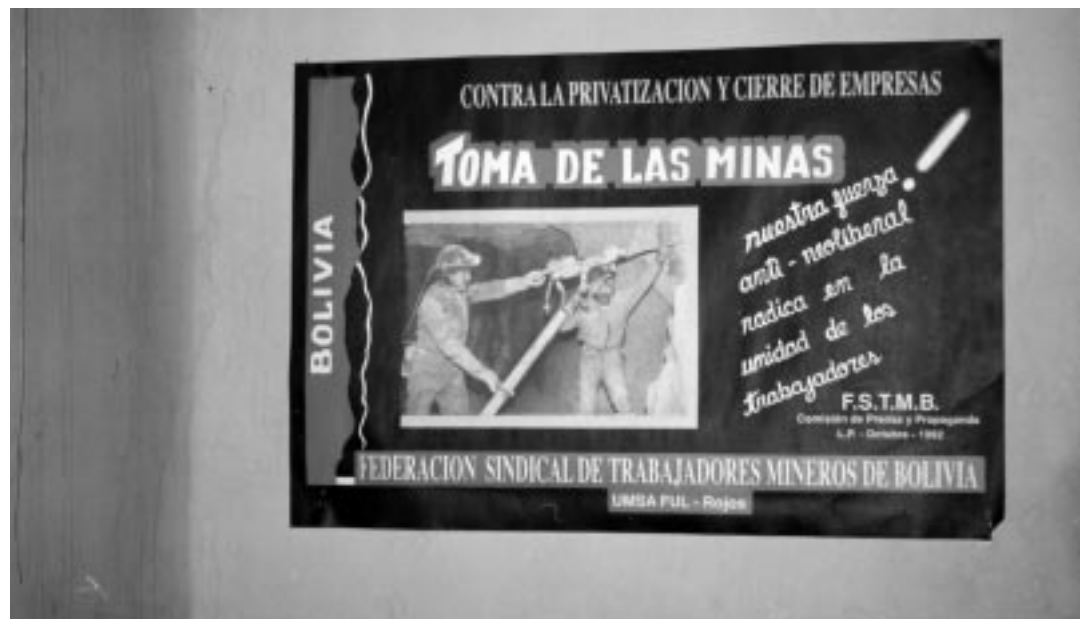
"Ta över gruvorna!" Affisch från den fackliga landsorganisationen COB i Bolivia

Lite klumpigt uttryckt kanske man kan säga att den lokala, direkta demokratin har kombine-