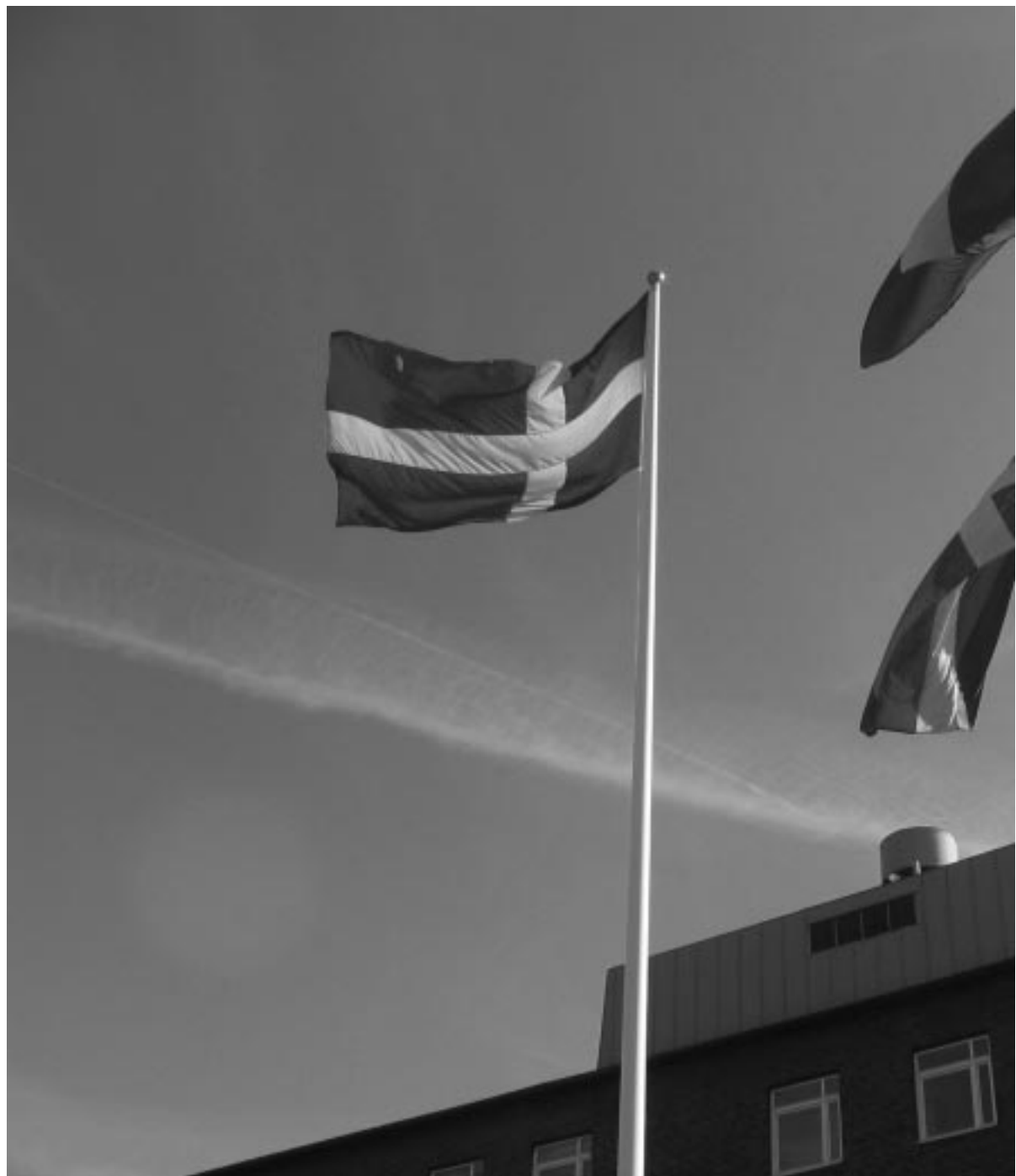
Att "riktig" historia är detsamma som nationell historia är en föreställning som hamrats in under så lång tid

Det går dock inte enbart att förklara det hela som en enkel reflex av den senaste högervågen. Kunga- och krigshistoriens renässans bottenar också i mer djupliggande och trögflytande ideologiska lager. En viktig roll spelar nationalismen. Historia har i praktiken kommit att likställas